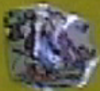
Mi familia está