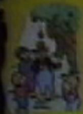
La familia está