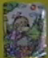
Mi hermana está