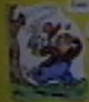
Los abuelos están