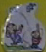
Mi hermano está