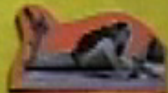
EN LA PLAYA