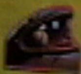
EN EL CARRO ALTISSIMO